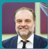
STEFANO GEUNA Magnifico Rettore Università degli Studi di Torino